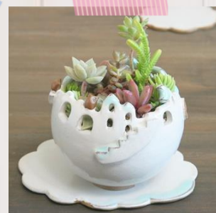
Atelier 陶 ya