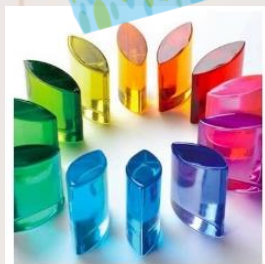
キレイデザイン学体験診断