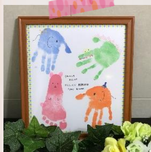
手形足形アート~Little クローバー~