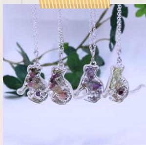
accessory 工房 MARIE